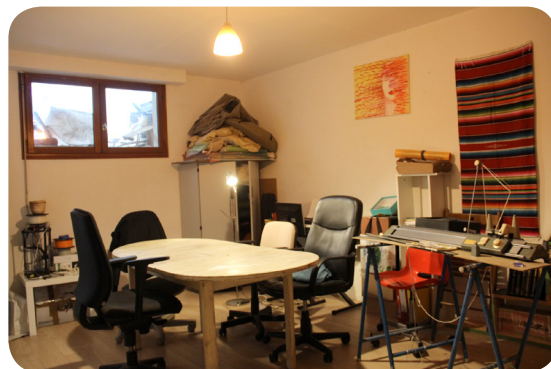
Le coworking / Espace de vie

Le garage est un atelier qui habrite des outils et une machine à coudre tandis que l'espace de coworking sert à travailler et à dormir pour les invités:)