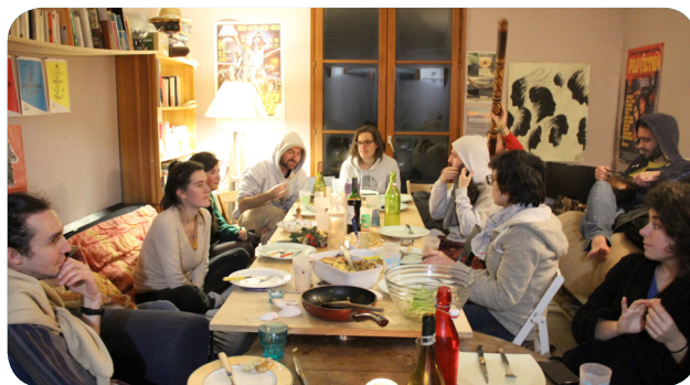
La pièce de vie principale