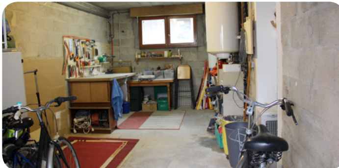
Le garage atelier