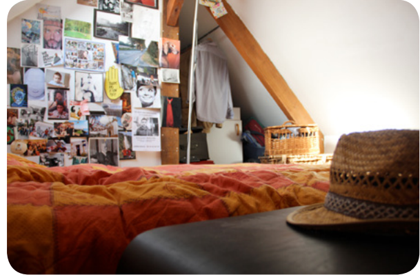
Plus communément appelée « La cabane »

ne chambre lumineuse qui partage le dernier étage de la maison avec un autre coloc et un espace dortoir pour les invités. Il n'y a pas de murs, puisque c'est une mezzanine, mais il n'y a presque pas de passage dans cette pièce puisque c'est le dernier étage. En somme, tu es au calme !)