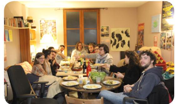
La pièce de vie (modulable!)