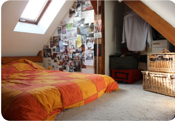
La chambre sous les toits !