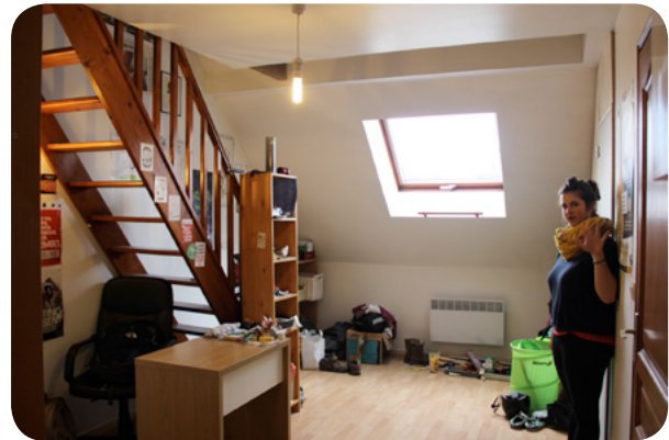
L'escalier qui monte à la chambre + un espace bureau où tu peux travailler + la douche à droite

Et bien sûr, tu intègres à part entière notre communauté :) Viens nous rencontrer !